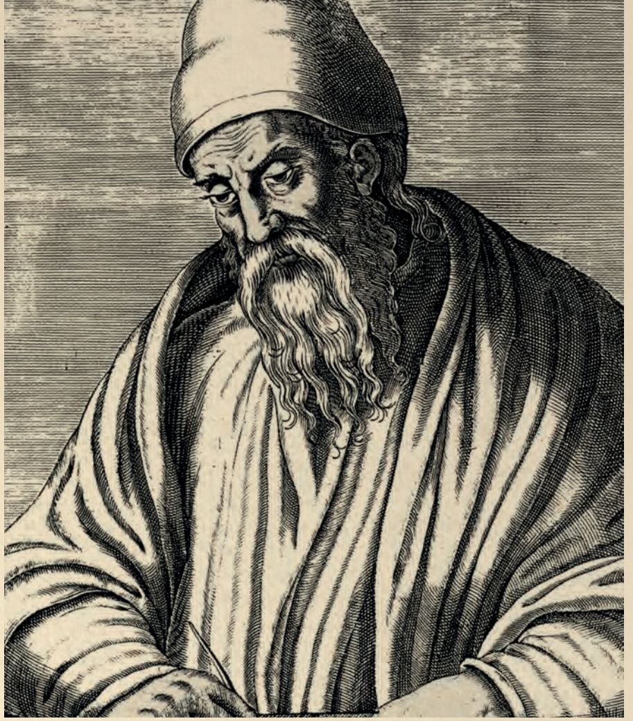
Öklid (MÖ 330 - 275)

B inlerce yıldır kitabı okunan, adı her anıldığında matematik dünyasında içten bir saygı uyandıran Öklid'in kim olduğu hakkında hiçbir sağlam veri yok. Mısır'ın İskenderiye şehrinde I. Ptolemy hâkimiyeti döneminde yaşadığı düşünülüyor. O dönemlerde yaşamış olan pek çok matematikçi ve oyun yazarı hakkında ayrıntılı bilgiler ulaşmış günümüze. Çoğunun eserleri kaybolmuş, günümüze erişen eserler de tarihi değerinin ötesinde bir etkiye sahip değil, ama yazarlarının neredeyse özel hayatlarını bile biliyoruz. Öte yandan yazdığı kitap insanlık düşünce tarihini derinden etkilemiş bu yazar hakkında, uydurma olduğundan şüphelendiğimiz, iki söylentiden başka bir bilgimiz yok.