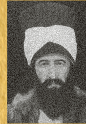
Hüseyin Rifkı Tâmani , Başhoca, mühendis, yazar. Osmanlı’da 1795 ile 1883 tarihleri arasında Mühendislik eğitimi vermiş olan Mühendishâne-i Berrî-i Hümayun’un, bir dönem başhocalığını yapan, mühendis ve alim.

Tamani’nin çevirisinde esas aldığı Bonycastle kopyası