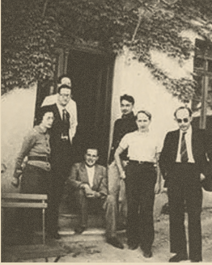
1938 Bourbaki toplantısı Soldan sağa: Simone Weil, Charles Pisot, Andre Weil, Jean Dieudonne, Claude Chabauty, Charles Ehresmann, Jeab Delsarte

Bir diğer söylentiye göre de Öklid'in Elemanlar kitabını inceleyen kralın "Geometri öğrenmek için bundan daha kolay bir yol yok mu?" serzenişine Öklid "Günlük hayatta avam ve kral için ayrı yollar vardır, ama geometriye giden bir kral yolu yoktur" diyerek cevap vermiştir. Bu hikâye de, az önceki hikâye gibi yıllar içinde başka antik dönem matematikçileri için de anlatılagelmiştir.